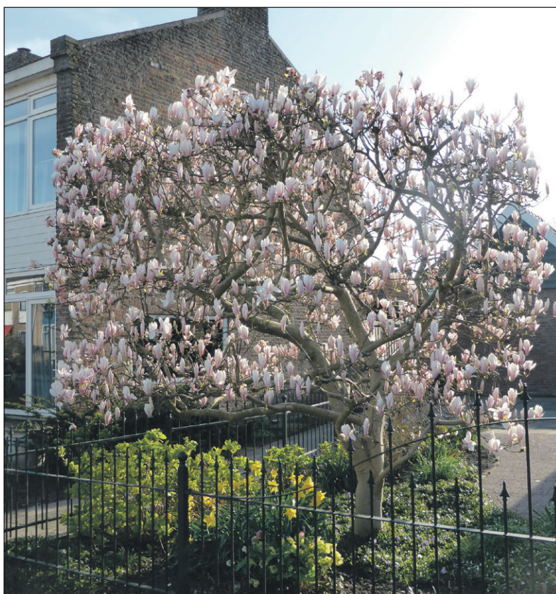
■ Een Magnolia in de William Pontstraat

Het is ook gewoonweg inspirerend en leerzaam, gluren bij de burens. Wil je wat nieuws in de tuin en weet je niet wat het goed doet bij jou, kijk dan eens een paar straten verderop naar tuinen met de zelfde omstandigheden. Wat het daar doet, doet het bij